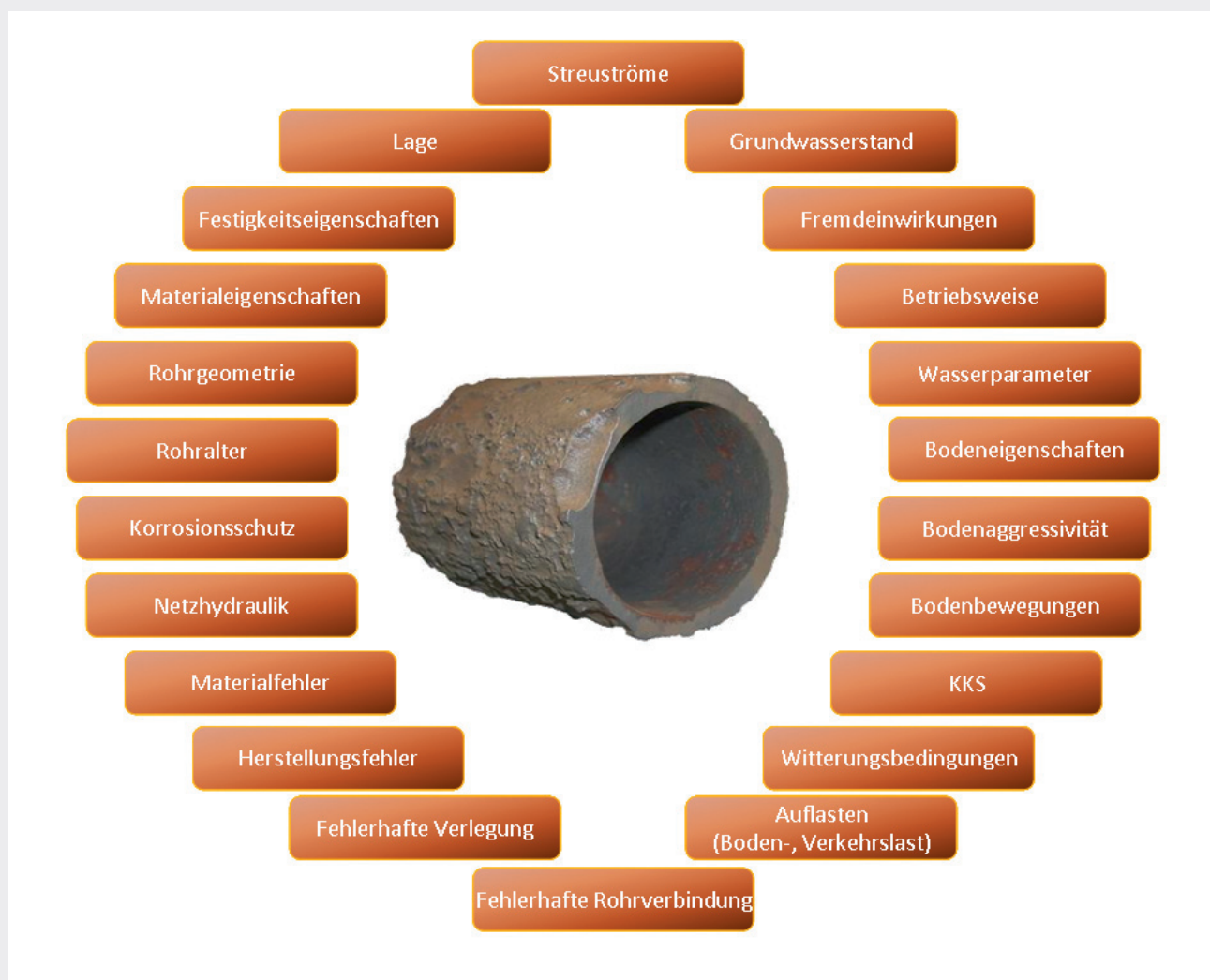
Fig. 1 Einflussfaktoren auf Zustand und Nutzungsdauer einer Trinkwasserleitung

Die Zustandserfassung erfolgt an Rohrproben, die aus dem Leitungsnetz herausgetrennt wurden. Reparaturen und Aufgra-